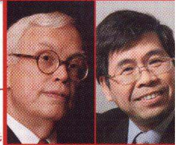
諾貝爾經濟學獎得主 赫克曼