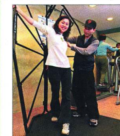
▲定期且有效的運動是健康的不二法門。