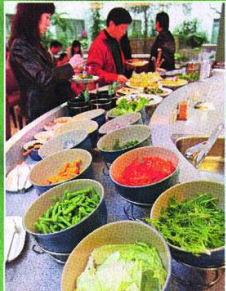
▲健康蔬果DIY餐區，提供生機飲食體驗與推廣。